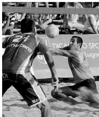
gegeneinander spielen. Am Samstag treten die Amateure Teams gegeneinander an, Turnierbeginn ist um 9.00 Uhr. Am Sonntag sind dann die Profis dran, ebenfalls mit Beginn ab 9.00 Uhr. Und am Samstagabend folgt auf den Sporttag eine Grill- und Beachparty ab 19.00 Uhr. Play with the stars, Sa. und So., 8. und 9. Juni, Centro sportivo, Tenero. mm