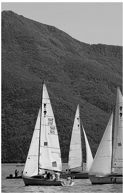
Acquaticissima, Sonntag, 9. Juni, 9.00-17.00 Uhr, Foce del Cassarate, Lugano.

Lugano steht dieses Wochenende ganz im Zeichen des Wassersports. Im Rahmen der Veranstaltung Acquaticissima hat die Bevölkerung die Möglichkeit, verschiedene Sportarten kennenzulernen. Bei der Mündung des Flusses Cassarate in Lugano sind fünf Wassersportvereine zu Hause: der Schwimmclub, der Ruderclub, die Lebensrettungsgesellschaft, der Segel- und der Kajakclub. Diese bieten Aktivitäten wie Schwimmen, Rudern, Kanufahren und Segeln zum Ausprobieren an. Zur Verfügung stehen zum Beispiel zwölf Kajaks und zwei Ruderboote. Die Lebensrettungsgesellschaft "Società di Salvataggio" führt zeitgleich "Sicuri sott'acqua" – sicher unter Wasser – durch und erklärt ihre Tätigkeit. Einige Taucherinnen und Taucher aus dem In- und Ausland werden anwesend sein und sich Tests von DAN Research unterziehen. DAN Europe ist im medizinischen Bereich tätig und untersucht verschiedene Aspekte des Tauchens. Am Sonntag werden auch Schifffahrten zu Grotti angeboten (Kosten für Fahrt und Essen CHF 20.- für Erwachsene, CHF 10.- bis 16 Jahre). Ausserdem sorgt die Makronata (CHF 5.-) für einen weiteren kulinarischen Höhepunkt. Wasserballfans sollten sich den heutigen und den morgigen Abend reservieren. Dann spielt nämlich die Mannschaft aus Lugano gegen Ägeri (Freitag) und Horgen (Samstag), Spielbeginn ist jeweils um 20.30 Uhr im Lido Lugano.